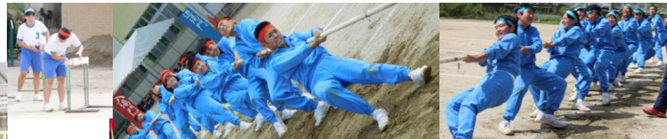
足のばせ～！空を見よ～！それ～引け～！ 綱引き うお～、あ、あれ？お、重い…。