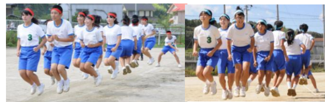
みんなで長縄 跳んだ最高回数がそのまま点になる、点数取り放題の種目

台風の影響で、16日の予定が18日に延期となり、開会式は1時間遅れの10時開始となりました。保護者の方を始め多くの方の応援ありがとうございました。