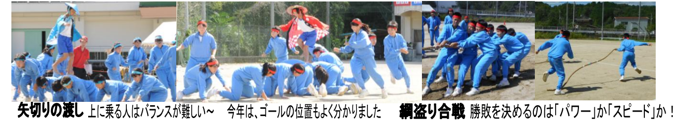
矢切りの渡し 上に乗る人はバランスが難しい~ 今年は、ゴールの位置もよく分かりました