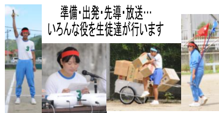
準備・出発・先導・放送… いろんな役を生徒達が行います