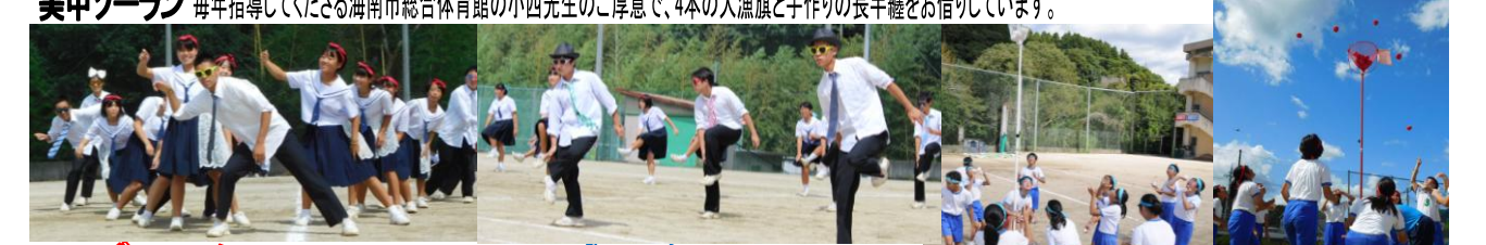
Aブロックパフォーマンスの部 最優秀賞 Bブロック 総合優勝