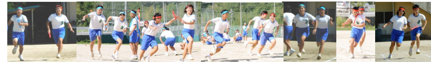
ブロック対抗リレー 今年は生徒全員が走りました。みんなでバトンをつないで、ゴールを目指しました。

台風の影響で、16日の予定が18日に延期となり、開会式は1時間遅れの10時開始となりました。保護者の方を始め多くの方の応援ありがとうございました。