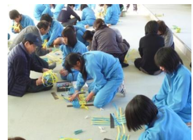
H25年度伝統文化体験事業1.29