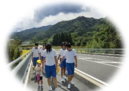
H24年度避難誘導訓練9.3